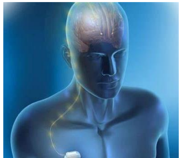
Figure 1 - Doctissimo, (2016)

Dans les 2 cas (tremblement essentiel ou secondaire), le traitement par la stimulation cérébrale profonde peut améliorer la situation.