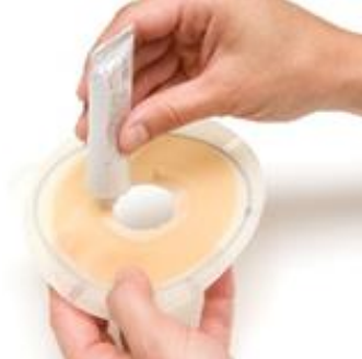
Figure 8 Application de la pâte.