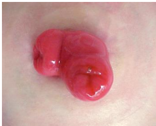
Figure 3 Stomie cintrée en boucle ou en anse.