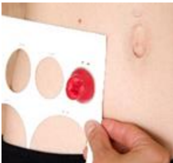
Figure 5 Mesure de la stomie.