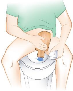
Figure 4 Vider le sac dans la toilette.