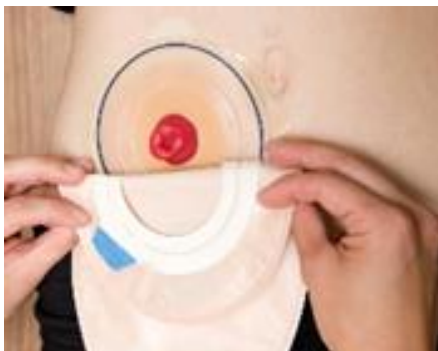
Figure 10 Pose du sac sur la collerette. Source : Service de photographie médicale, CHU de Québec-Université Laval, 2017.