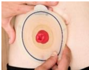
Figure 9 Collerette autour de la stomie.