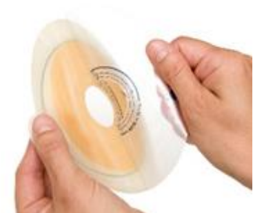
Figure 7 Retrait de la pellicule protectrice.