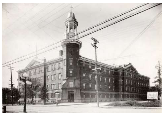
Hôpital Saint-François-d'Assise, [Vers 1930], BANQ Québec, Fonds l'Action Catholique, (03Q,P428,S3,SS1,D13,P13-7), Photographe non identifié.

Si plusieurs hôpitaux voient le jour dans la ville au XIX e siècle – pensons entre autres aux hôpitaux de la Marine et de la Garnison qui n'existent plus aujourd'hui, ou encore au Jeffery Hale qui a toujours pignon sur rue –, il faut attendre le XX e siècle pour voir une série de nouveaux établissements francophones naître. Les importantes avancées de la médecine et l'accroissement de la population rendent nécessaires la création de nouveaux établissements dans d'autres secteurs de la ville.