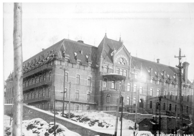
Hôpital Hôtel-Dieu - Pavillon d'Aiguillon, [vers 1900]