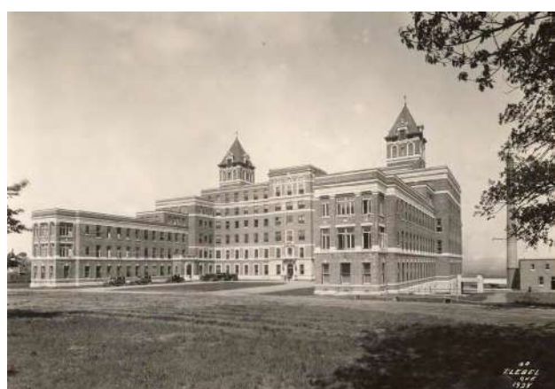
Quartier Saint-Sacrement - Chemin Sainte-Foy - Vue Éloigné de l'hôpital Saint-Sacrement, 1928