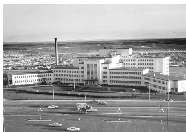
Le CHUL autour de 1955.

Au cours de la deuxième moitié du XX e siècle, ces cinq hôpitaux se développent parallèlement. Pour ne citer que quelques exemples, l'Hôpital Saint-François d'Assise voit sa mission renforcée en 1985 en devenant le centre reconnu en périnatalité pour la Capitale-Nationale et l'est du Québec, l'Hôpital du Saint-Sacrement met sur pied le premier laboratoire moderne de recherche en hématologie au Québec et l'Hôtel-Dieu de Québec voit un important centre d'oncologie se développer en ses murs. L'expansion de chacun de ces hôpitaux ne se fait pas sans d'importants investissements. Soucieux d'offrir à chacun d'eux des équipements à la fine pointe de la technologie tout en s'assurant d'éviter que les forces vives de chaque domaine ne soient dispersées sur plusieurs sites, la Régie régionale de la santé et des services sociaux et le ministère de la Santé et des Services sociaux décident d'opérer des fusions au milieu des années 1990.