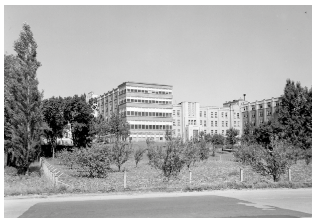
Hôpital de l'Enfant-Jésus, Québec, 1950, BANQ Québec, Fonds Ministère de la Culture et des Communications, (03Q,E6,S7,SS1,P78600), Paul Carpentier.

domicile, ils peuvent, avec la création de l'Hôpital Saint-François d'Assise, se dérouler dans un environnement plus sain doté d'une salle d'accouchement et d'une pouponnière. C'est une petite révolution à Québec.