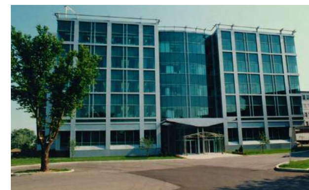
Le CRCHU sur le site du CHUL.

Les activités de recherche fondamentale, clinique et évaluative du Centre de recherche situées à l'Hôtel-Dieu de Québec sont axées sur l'oncologie, la thérapie génique et la néphrologie.