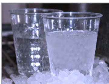
Nathalie Mathieu, photographie médicale, LHDQ