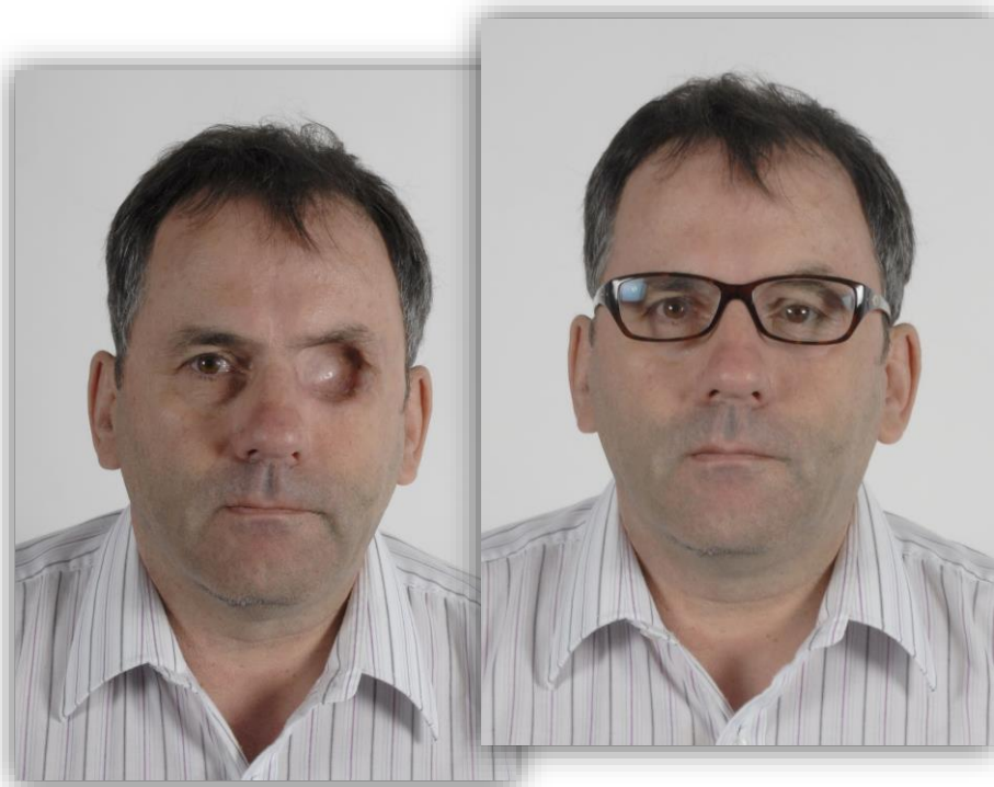
Cause: cancer de l'oeil