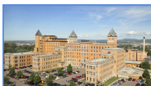
Hôpital du Saint-Sacrement 1050, chemin Sainte-Foy, Québec (Québec) G1S 4L8

De plus, il comprend un centre de recherche intégré au Centre de recherche du CHU et le Centre ménopause Québec.