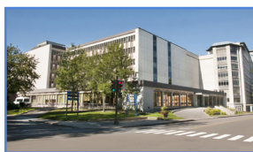
Hôpital Saint-François d'Assise 10, rue de l'Espinay, Québec (Québec) G1L 3L5

Les activités de recherche fondamentale, clinique et évaluative du Centre de recherche du CHU situé à l'Hôpital de l'Enfant-Jésus sont axées sur la traumatologie, la santé des populations, le génie tissulaire, la médecine régénératrice, la médecine d'urgence et les soins intensifs.