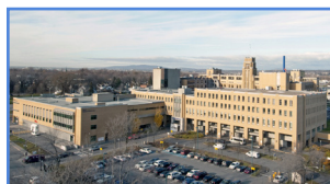
Hôpital de l'Enfant-Jésus 1401, 18 e Rue, Québec (Québec) G1J 1Z4

Le CHUL dispose également d'un important centre de recherche intégré au Centre de recherche du CHU. Près d'une quinzaine de psychologues travaillent au CHUL dans divers secteurs d'activités : psychogériatrie, psychiatrie adulte, pédopsychologie médicale, prématurité, etc.