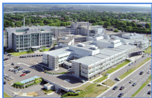
CHUL 2705, boulevard Laurier, Québec (Québec) G1V 4G2

Le CHUL est un hôpital de soins spécialisés et surspécialisés qui comprend une urgence régionale à très fort volume d'activités. Il est le centre de référence psychiatrique adulte de l'ouest de la grande région de Québec et le centre de pédiatrie et d'obstétrique « Centre mère-enfant Soleil » (CMES) régional et suprarégional pour l'Est du Québec. Le regroupement de la pédiatrie et de l'obstétrique au CMES propose une approche des soins qui favorise la participation de l'ensemble de la famille. L'infrastructure physique pour les services cliniques comprend des lits d'hospitalisation, des activités ambulatoires, des services de consultations externes, des salles d'opération et des civières d'urgence.