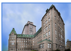
L'Hôtel-Dieu de Québec 11, côte du Palais, Québec (Québec) G1R 2J6

Les activités de recherche fondamentale, clinique et évaluative du Centre de recherche du CHU situées à l'Hôpital du Saint-Sacrement sont axées sur l'ophtalmologie et la sénologie.