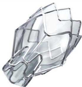
Figure 1. Valve Zephyr® (PulmonX)

Le système de valve Zephyr® (Figure 1) a fait l'objet d'une approbation de la FDA ( Food and Drug Administration ) américaine en 2018 [7], mais n'est pas encore homologué par Santé Canada [8]. Ce système est également homologué en Europe. Il s'agit d'une valve unidirectionnelle implantée à l'aide d'un cathéter d'administration inséré à travers un bronchoscope dans le lobe endommagé du poumon. La procédure dure entre 30 et 60 minutes et est effectuée sous sédation ou sous anesthésie générale. Le système de valve Spiration® (Figure 2) a été homologué par Santé Canada (dispositif médical de classe II) [9] et par la FDA américaine en 2016. Par contre, le dispositif avait fait l'objet d'une exemption par la FDA en 2008 pour le traitement des fuites d'air prolongées [10]. La valve Spiration® ressemble à un petit parapluie avec un cadre et cinq ancrages pour sécuriser la valve [11].